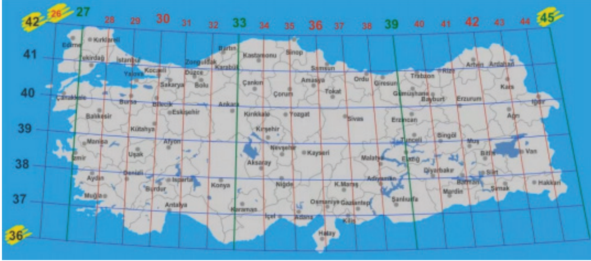
Türkiye'nin Matematik Konumu

Verilen haritadan yola çıkarak ülkemizin matematik konumu ve sonuçları ile ilgili aşağıdaki-lerden hangisi söylenemez ?